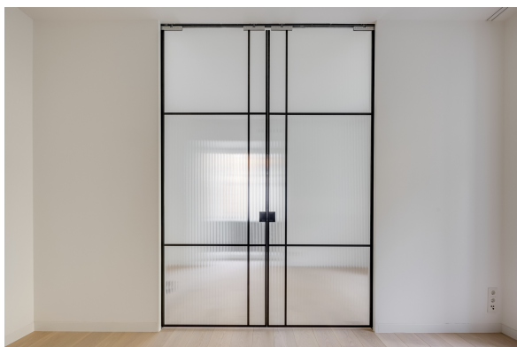
Schiebtüre im Loftstyle