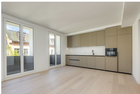
Designer-Einbauküche von next125