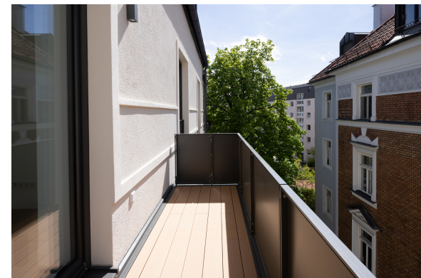
Großer, geschützter + verkleideter Balkon