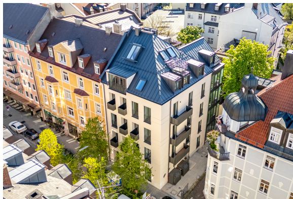
Blick auf das Objekt