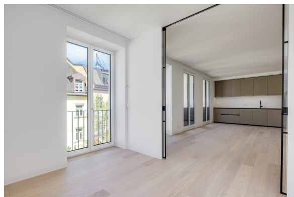
Blick aus dem Arbeitszimmer