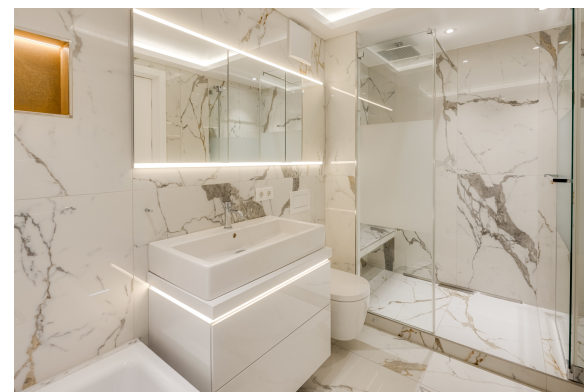
Elegantes Badezimmer in Marmoroptik